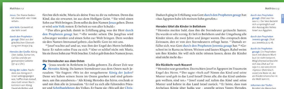
Abbildung: »Die Kompakte«. Die Bibel lesen wie einen Roman.

In der »kompakten« Ausgabe ist der Bibeltext gesetzt wie bei einem Roman. Ein gewohntes Schriftbild mit vielen hilfreichen Überschriften. Dadurch entsteht ein einfacher Lesefluss. Der Umfang der Ausgabe ist handlich.